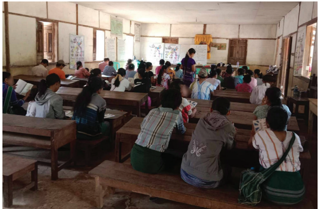
၂။ လူထုဥပဒေအထောက်အကူပြုအဖွဲ့ (CLV)မှ မူကြော်ခရိုင်ရှိ ရပ်ရွာလူထုများအား ဥပဒေအသိပညာပေးခြင်း။