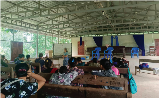
၃။ လူထုအထောက်အကူပြုအဖွဲ့ (CLV)မှ ဒူးပလာယာ ခရိုင်ရှိ ရပ်ရွာလူထုများအား ဥပဒေအသိပညာပေးခြင်း။