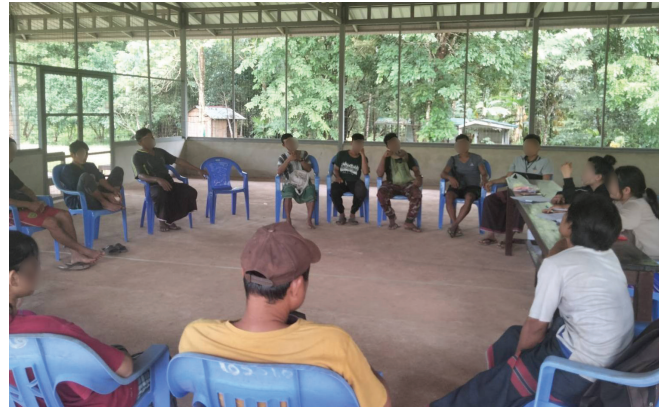
၄။ လူထုအထောက်အကူပြုအဖွဲ့ (CLV)မှ ဒူးပလာယာ ခရိုင်ရှိ ရပ်ရွာလူထုများအား ဥပဒေအသိပညာပေးခြင်း။