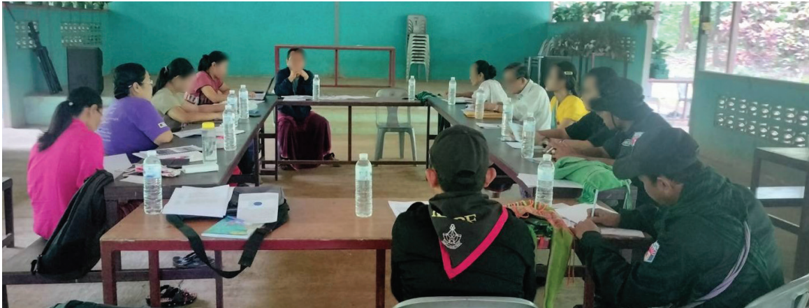
အကျဉ်းထောင်စီမံခန့်ခွဲခြင်းနှင့် အကျဉ်းထောင်ဥပဒေကြမ်းရေးဆွဲရေးဆိုင်ရာ အလုပ်ရုံဆွေးနွေးပွဲ

၂၀၂၃ ခုနှစ်၊ ဇူလိုင်လတွင် ပြည်ထဲရေးနှင့်သာသနာရေးဌာနမှူးမှ ဦးဆောင်ပြီး အကျဉ်းထောင်စီမံခန့်ခွဲခြင်းနှင့် အကျဉ်းထောင် ဥပဒေကြမ်းရေးဆွဲရေးဆိုင်ရာ အလုပ်ရုံဆွေးနွေးပွဲကိုပြုလုပ်ခဲ့သည်။ အဆိုပါ အလုပ်ရုံဆွေးနွေးပွဲတွင် ဗဟိုတရားသူကြီးချုပ်၊ ဗဟိုတရားရေး ဌာနမှူး၊ ဖားအံခရိုင်တရားသူကြီး၊ ဖားအံခရိုင် ရဲမှူးနှင့် ကရင်ဥပဒေအထောက်အကူပြုအဖွဲ့တို့မှ ကျား -၇ ဦး၊ မ -၆ ဦး၊ စုစုပေါင်း ၁၃ ဦး အလုပ်ရုံ ဆွေးနွေးပွဲသို့ တက်ရောက်ဆွေးနွေးခဲ့ကြသည်။