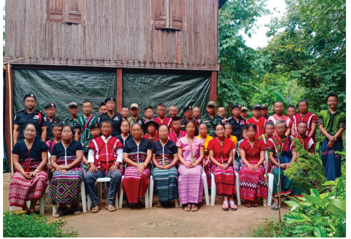
မူကြော်ခရိုင် တရားရေးဝန်ဆောင်မှုပေးသူများ အစည်းဝေးကျင်းပခြင်း