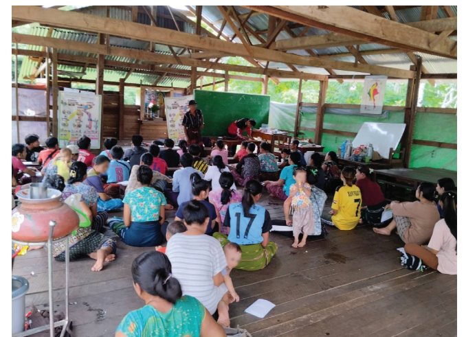
၈။ လူထုအထောက်အကူပြုအဖွဲ့ (CLV)မှ ဖားအံ ခရိုင်ရှိ ရပ်ရွာလူထုများအား ဥပဒေအသိပညာပေးခြင်း။