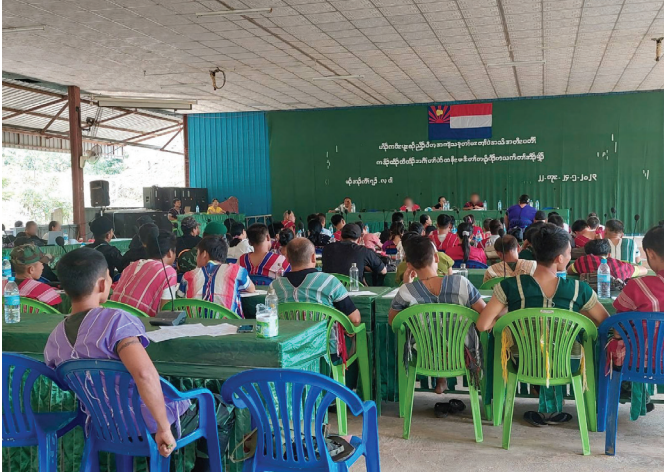
ဖားအံခရိုင် တရားရေးဝန်ဆောင်မှုပေးသူများ အစည်းဝေးကျင်းပခြင်း