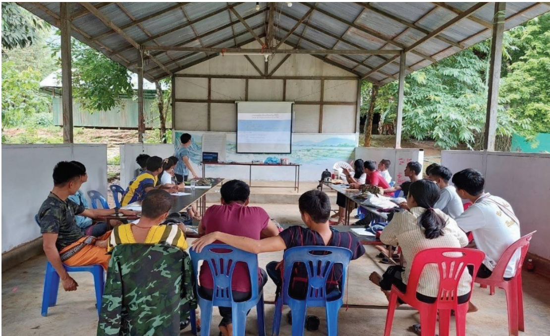
ဗဟိုစည်းရုံးရေးနှင့် ပြန်ကြားရေးဌာနရှိ ဌာနဆိုင်ရာဝန်ထမ်းများအား ဥပဒေသင်တန်းပေးခြင်း

စည်းရုံးရေးနှင့်ပြန်ကြားရေးဝန်ထမ်းများအနေဖြင့် ကော်သူးလေတရားရေးဆိုင်ရာနှင့် ပတ်သက်သည့် အကြောင်းအရာများကို သင်တန်းတွင် လေ့လာခွင့်ရခဲ့သည့်အတွက် ၎င်းတို့အနေဖြင့် ကျေးရွာအတွက် လိုအပ်သော တရားရေးအသိပညာများကို ပြန်လည်ဖြန့်ဝေပေးနိုင်မည်ဖြစ်ပါသည်။