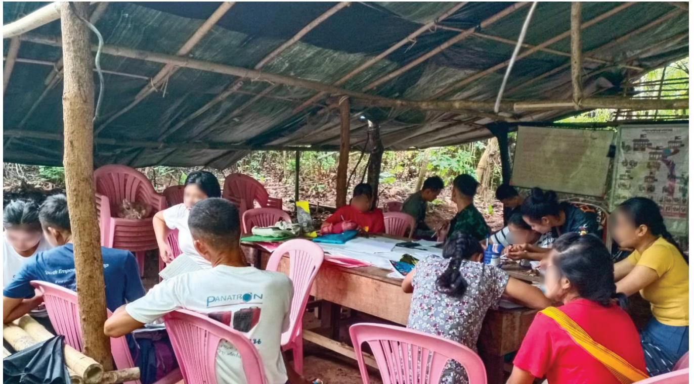
လူထုဥပဒေအထောက်အကူပြုအဖွဲ့ (CLV)အား မွမ်းမံသင်တန်းပေးခြင်း

၂၀၂၃ ခုနှစ်၊ မေလနှင့် ဇွန်လများတွင် လူထုဥပဒေအထောက်အကူပြုအဖွဲ့ (CLV) မွမ်းမံသင်တန်းကို ဖားအံ နှင့် မူကြော်ခရိုင်တွင် ပြုလုပ်ခဲ့ပါသည်။ သင်တန်းတွင် ၎င်းတို့လုပ်ဆောင်ခဲ့သောလုပ်ငန်းများကို မတူညီသော အတွေ့အကြုံများပေါ်မူတည်ပြီး ပြန်လည်သုံးသပ်ခြင်း၊ ဆက်သွယ်ရေးနှင့် ပတ်သက်သော နည်းပညာများ ထပ်မံပံ့ပိုးပေးခြင်း၊ ပြစ်မှုဆိုင်ရာဥပဒေများ၊ တရားမဆိုင်ရာ ကျင့်ထုံးဥပဒေများနှင့် CLVများအနေဖြင့် လက်ရှိဒေသအခြေနေများပေါ်မူတည်ပြီး ကြုံတွေ့နေရသော အခက်အခဲများကို အချင်းချင်း ပြန်လည်မျှဝေ ဆွေးနွေးခဲ့ကြပါသည်။