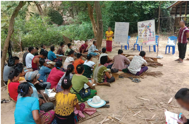
၁။ လူထုအထောက်အကူပြုအဖွဲ့ (CLV)မှ မူကြော်ခရိုင်ရှိ ရပ်ရွာလူထုများအား ဥပဒေအသိပညာပေးခြင်း။