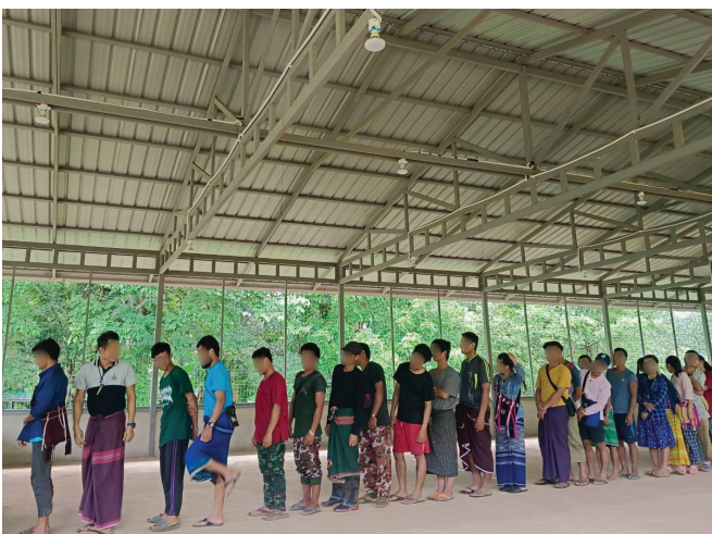
၇။ လူထုအထောက်အကူပြုအဖွဲ့ (CLV)မှ ဒူးပလာယာ ခရိုင်ရှိ ရပ်ရွာလူထုများအား ဥပဒေအသိပညာပေးခြင်း။