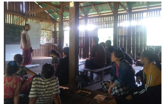
၆။ လူထုအထောက်အကူပြုအဖွဲ့ (CLV)မှ ဖားအံ ခရိုင်ရှိ ရပ်ရွာလူထုများအား ဥပဒေအသိပညာပေးခြင်း။