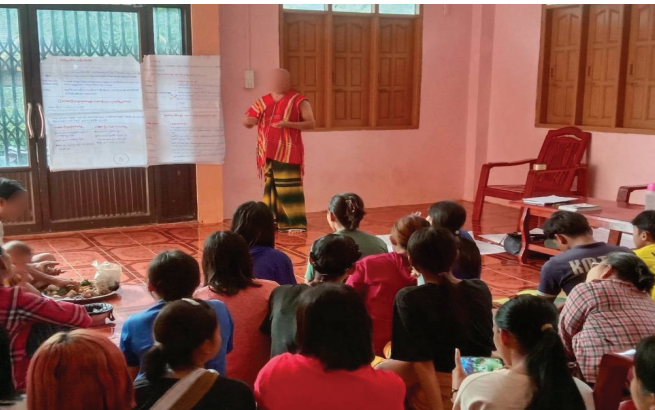
၅။ လူထုအထောက်အကူပြုအဖွဲ့ (CLV)မှ ဖားအံ ခရိုင်ရှိ ရပ်ရွာလူထုများအား ဥပဒေအသိပညာပေးခြင်း။