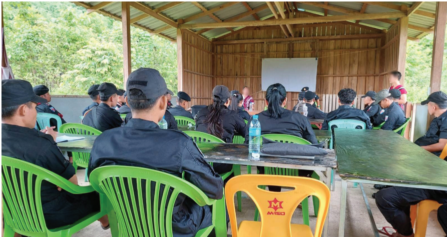
ကရင်အမျိုးသားရဲတပ်ဖွဲ့ (KNPF) အား ဥပဒေဆိုင်ရာ ဆရာဖြစ် သင်တန်းပေးခြင်း

ကရင်အမျိုးသားရဲတပ်ဖွဲ့ (KNPF) အား ဥပဒေဆိုင်ရာ ဆရာဖြစ် သင်တန်းပေးခြင်းအစီအစဉ်ကို ဆောင်ရွက်ခဲ့သည်။ သင်တန်းတွင် တောင်ငူခရိုင်၊ ညောင်လေးပင်ခရိုင်၊ ဘိတ်ထားဝယ်ခရိုင်၊ မူကြော်ခရိုင်၊ ဒူးပလာယာခရိုင်နှင့် ဖားအံခရိုင်တို့မှ စေလွှတ်သည့်ကိုယ်စားလှယ် ကျား(၂၁)ဦး၊ မ(၅)ဦး တက်ရောက်ခဲ့ပြီး၊ ကရင်ဥပဒေအထောက်အကူပြုအဖွဲ့ (KLAC)မှ သင်တန်းဆရာ/မ (၃)ဦးတို့မှ ဥပဒေသင်တန်း ပို့ချခဲ့ပါသည်။ သင်တန်းတွင် ရပ်ရွာအခြေပြုရဲလုပ်ငန်း၊ ဒီမိုကရေစီကျင့်သုံးသောနိုင်ငံတစ်ခုတွင် ကျင့်သုံးလေ့ရှိသော တရားရေးစနစ်နှင့် ကော်သူးလေတရားရေးစနစ်အား လေ့လာခြင်း၊ တရားမကျင့်ထုံးနှင့် တရားမမှုဖြစ်စဉ်၊ ရာဇဝတ်ကျင့်ထုံးဥပဒေ၊ ဥပဒေနှင့်ကျင့်ထုံးကြား ဆက်စပ်ပုံ၊ အမှုဖြစ်စဉ်နှင့် တရားရုံ မရောက်မှီ အမှုပြင်ဆင်ခြင်းတို့ကို ဆွေးနွေးလေ့လာခဲ့ကြပါသည်။ ထို့ပြင် တရားရုံးများအတွင်း ရဲများ၏ အခန်းကဏ္ဍနှင့် ရဲလုပ်ငန်းနှင့် ဆိုင်သော ပုံစံ(Form)များကို အပြန်အလှန်ဆွေးနွေးခဲ့ကြသည်။