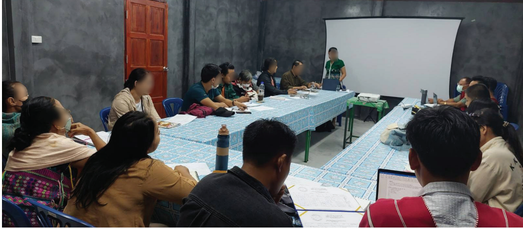
မူးယစ်ဆေးဝါး (ဘိန်းစာရွက်) ဆိုင်ရာပြဿနာအား ဆွေးနွေးခြင်းအစည်းအဝေး

ဒေသတွင်းပျံ့နှံ့လာသည့် မူးယစ်ဆေးဝါး (ဘိန်းစာရွက်) ဆိုင်ရာပြဿနာ အားကိုင်တွယ်ဖြေရှင်းနိုင်ရန် ၂၀၂၃ ခုနှစ်၊ ဇူလိုင်လတွင် အစည်းအဝေးတစ်ရပ်ကို ကျင်းပပြုလုပ်ခဲ့သည်။ အစည်းအဝေးသို့ ကေအဲန်ယူ-ကရင်အမျိုးသားအစည်းအရုံးခေါင်းဆောင်များ၊ ကရင် ပညာရေးနှင့်ယဉ်ကျေးမှုဌာန၊ ကရင်ကျန်းမာရေးဌာန အပါအဝင် ကရင်လူမှုအဖွဲ့အစည်းများဖြစ်သည့် KWO၊ KYO၊ KHRG၊ BPHWT၊ DARE နှင့် KSNGတို့မှ ကျား (၁၀)ဦး၊ မ(၁၀) ဦး စုစုပေါင်း (၂၀)ဦးတက်ရောက်ဆွေးနွေးခဲ့သည်။ ဆွေးနွေးပွဲတွင် ဒေသတွင်း လူငယ်များ အကြား ပျံ့နှံ့လာသည့် ဘိန်းစာရွက်အသုံးပြုမှုများနှင့် အကျိုးဆက်များကို အပြန်အလှန်ဆွေးနွေးခဲ့ကြသည်။